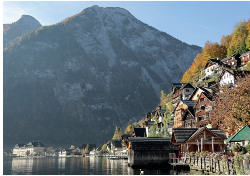
Zeit wird's, dass das Wetter wieder besser wird.