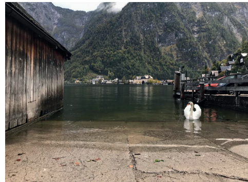
Schwanzzeit: Die ist eigentlich nie, weil Schwäne gefährlich sind.