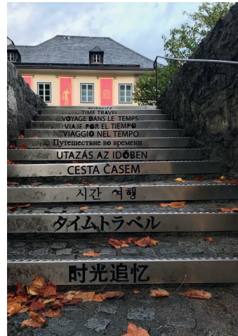
Zeitreise: Einstweilen wird es Herbst.