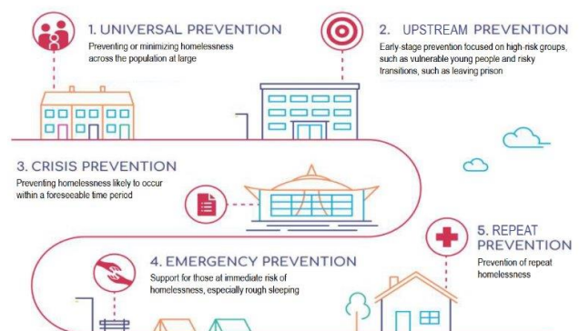
Abb. 1: Prävention von Obdachlosigkeit als Fluss (Fitzpatrick et al., 2012)

Trotz zahlreicher guter Gründe für und trotz des Potentials von Delogierungsprävention stiegen die Delogierungskennzahlen zuletzt rasant an (siehe Abbildung 2). Nach einem deutlichen Einbruch durch Maßnahmen im Zuge der COVID19-Pandemie, insb. dem Aussetzen der Delogierungen in unterschiedlichen Segmenten des Wohnungsmarktes, haben exekutierte Delogierungen wieder das vorpandemische Niveau erreicht und mancher Orts sogar übertroffen. Besonders bedenklich ist in diesem Kontext, dass Räumungsklagen und Kündigungen in fast allen Bundesländern dieses Niveau noch nicht erreicht haben. Diese Tatsache sowie der Umstand, dass es Steigerungen bei Delogierungen um die 10 % von 2023 auf 2024 gab, lassen für zukünftige Jahre eine weitere Steigerung annehmen – sofern es beim wohn- und sozialpolitischen Status Quo bleibt. Die Delogierungskennzahlen könnten dann eine Dimension erreichen, die im vergangenen Jahrzehnt (trotz erheblich nachteiliger Politik von Schwarz-Blau) unbekannt war.